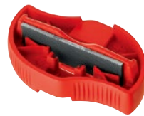
TA3009 サイド 89°～86° ベース 0.5°、1° 6-WAY チューナー ¥5,200 +税 Made in Italy