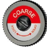
TA3013XF エクストラファイン TA3013F ファイン TA3013M ミディアム TA3013G コース スベアディスク ¥12,000 +税