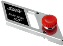
TA005N 0.5°用 TA0075N 0.75°用 TA010N 1°用 ベースエッジベベルガイド ¥6,500 +税 Made in Italy