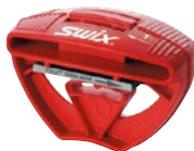
TA3001 ベースエッジ=0.5°、1° サイドエッジ= 87°、88° 2×2 エッジシャープナー ¥2,800 +税 Made in Italy