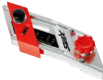
TA0520 0.5°～2° アジャスタブル ベースエッジベベルガイド ¥8,200 +税 Made in Italy