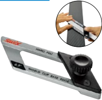
TA05N 0.5°用 TA075N 0.75°用 TA10N 1°用 TA15N 1.5°用 TA20N 2°用 ベースエッジファイルガイド ¥14,000 +税 Made in Italy