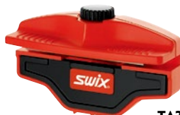
TA3007 90°～85° サイドエッジシャープナー ¥6,000 +税 Made in Italy