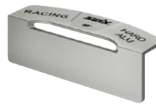
TA585 85°用 TA586 86°用 TA587 87°用 TA588 88°用 TA589 89°用 ファイルガイド ¥5,800 +税 Made in Italy