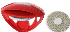
TA3004 サイドエッジ= 87°、88° ダイヤモンドディスクチューナー ¥4,500 +税 Made in Italy