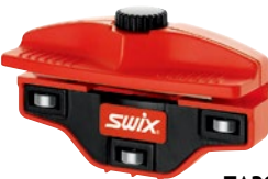
TA3008 90°～85° ローラー付きサイドエッジシャープナー ¥8,000 +税 Made in Italy