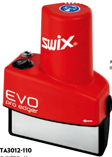
TA3012-110 エボプロエッジャー ¥90,000 +税