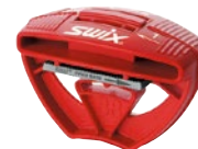
TA3005 カービングキット ¥6,300 +税 Made in Italy